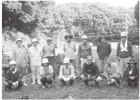
うーたの会 9月15日草刈り作業、終わりました！ お疲れ様です。

行ける方はどちらでも加勢に行ってください。身近な里山の荒廃がいつ水災害に繋がるかもしれません。最近は想定外の災害が多いのですが、できる事から始めましょう。