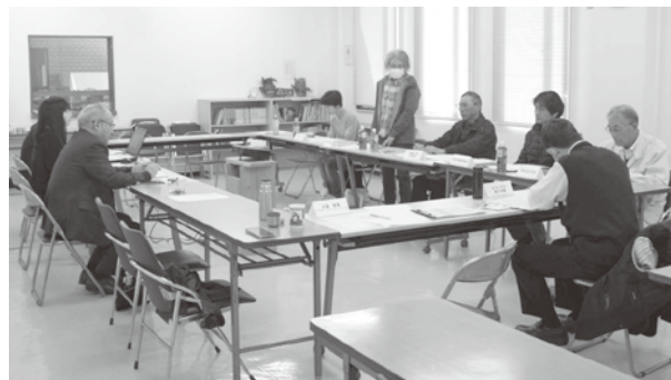
森林ボランティア団体意見交換会の様子

3月18日に森林ボランティア団体の代表者8名が集まって、意見交換会を行いました。お互いに初めてお会いした方がほとんどでしたが、すぐに打ち解けて、現場のノウハウの話に盛り上がりました。良い刺激になったというご意見もいただき、来年度もまた集まって意見交換会を実施したいと思いました。